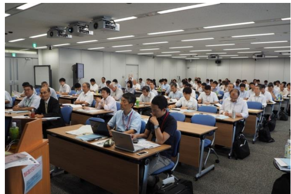
講義に聞き入る参加者